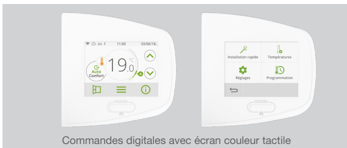
Commandes digitales avec écran couleur tactile