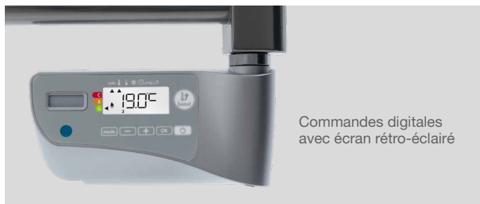
Commandes digitales avec écran rétro-éclairé