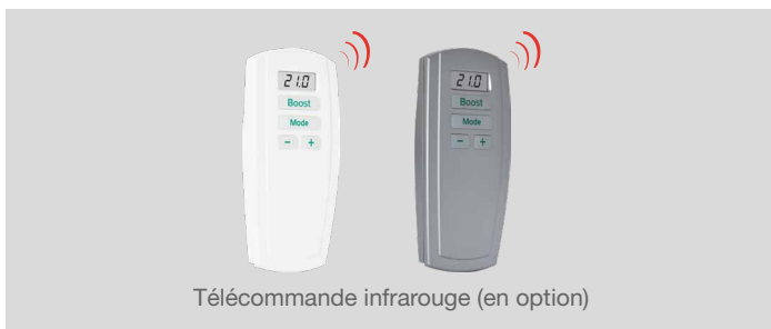
Télécommande infrarouge (en option)